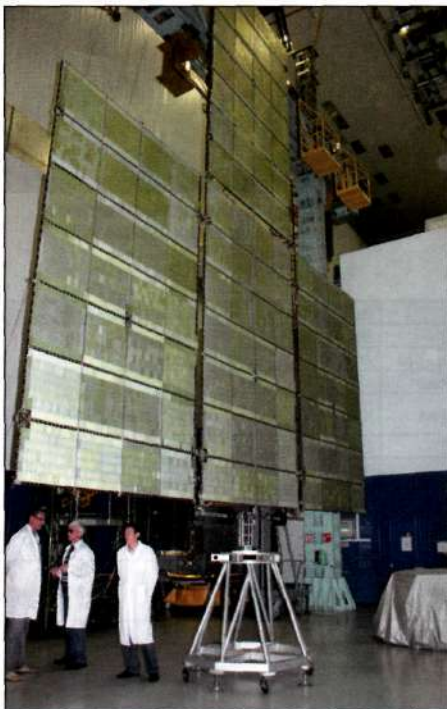
Статические испытания панели солнечной батареи

К осмическая отрасль, наряду с авиацией и атомной промышленностью, всегда была двигателем прогресса в смежных областях, таких как электроника и приборостроение, автоматика и точное машиностроение. При реализации каждой космической программы создается и внедряется целый комплекс инновационных технологий. Такими технологиями обладает ОАО «ИСС». Подтверждением этому является более 50 типов спутников, имеющих поистине «космическую» репутацию и предназначенных для использования на круговых, высокоэллиптических и геостационарных орбитах. Это «Молния», «Радуга», «Гонец», «Горизонт», «Экран», «Луч», «Глонасс», «Галс», «Экспресс». Многие из них наработали двойной и тройной орбитальный ресурс. Важнейшим элементом обеспечения качества спутника является проведение наземной экспериментальной обработки.